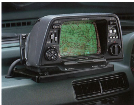
図2 世界初の地図表示型カーナビ

1974年、カーメーカの研究所の一室にジャイロが持ち込まれ、車への応用の議論が白熱した。そして、車載用ジャイロ（ヨーレートセンサ）の開発と自動車への新機能開発の研究チームが発足した。従来の車の制御システムとは全く異質の開発で、当時GPS (Global Positioning System) はいまだ計画途上であり、自己位置標定は航空機と同じように自律形の慣性航法で実現させようとする自動車用慣性航法システムへのチャレンジであった。自動車がハンドルの操作で方向変化をするときのヨー方向の角速度変化とタイヤの回転量を基準に、マイクロコンピュータで慣性航法計算や各種の累積誤差補正処理を行い現在位置の推移を刻々標定し地図位置と対比表示する世界初の地図表示型カーナビゲーションシステム (図2) として、1981年、「ホンダ・エレクトロ・ジャイロケータ」の商品名で発表された。システム構成