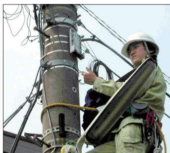
(b) 光宅内分岐：光ファイバは光スプリッタを介して各家に配線