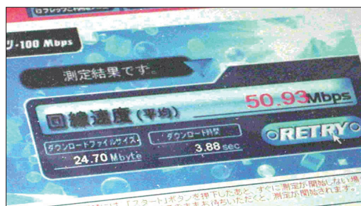
(c) 速度測定：回線速度は50.93Mbit/sを記録