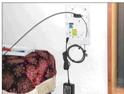
(a) 宅内光終端：光ファイバは各家で終端

日本ではARIB(一般社団法人電波産業会)が、通信・放送分野における電波利用システム、いわゆる無線系システムに関する標準化を担当し、TTCは有線系システムに関する標準化を担当しています。また、5Gなど有線系と無線系の融合が必要な分野では連携を図っています。